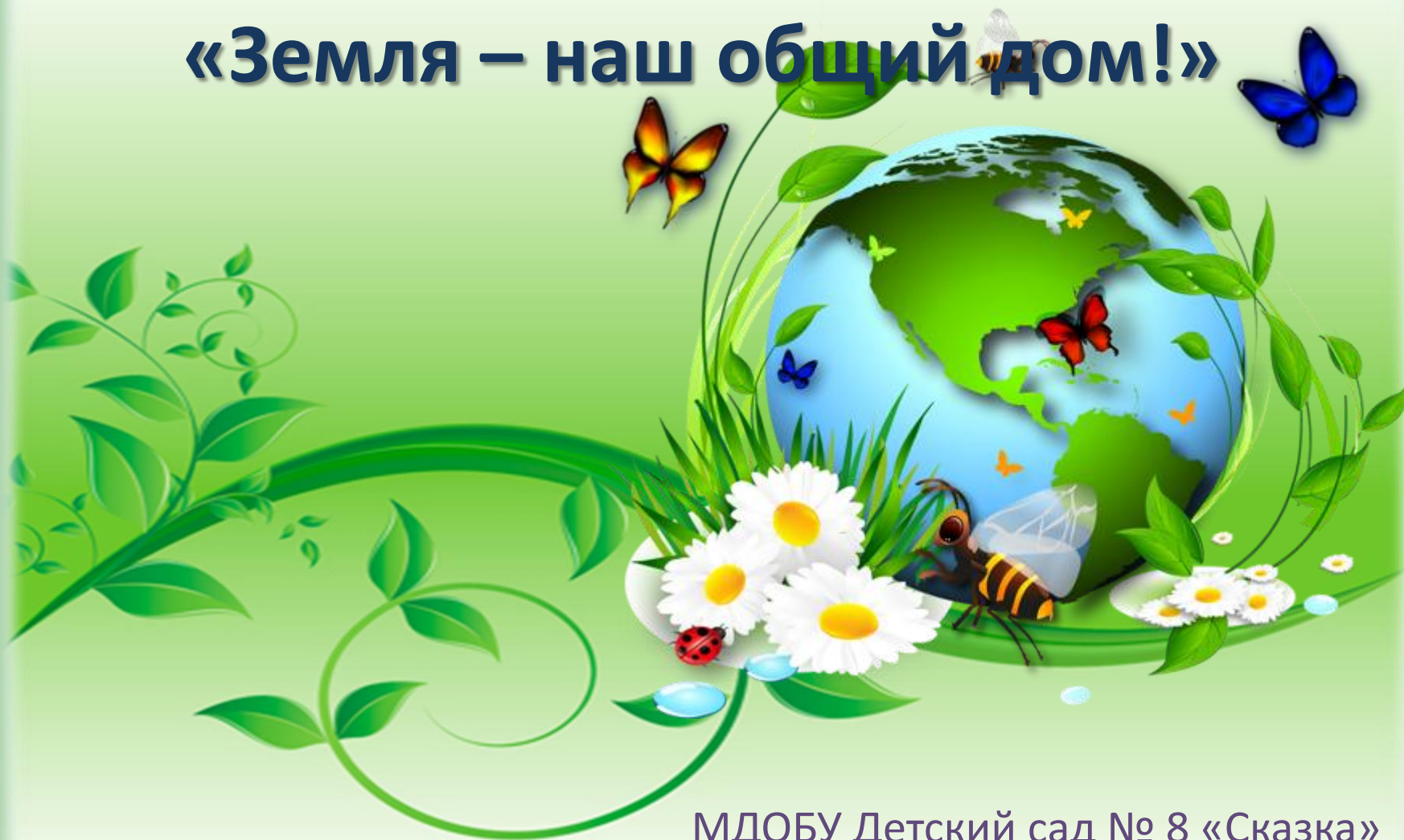
Фото отчёт по теме: «Земля – наш общий дом!»

МДОБУ Детский сад № 8 «Сказка» Группа № 11 «Колобок»