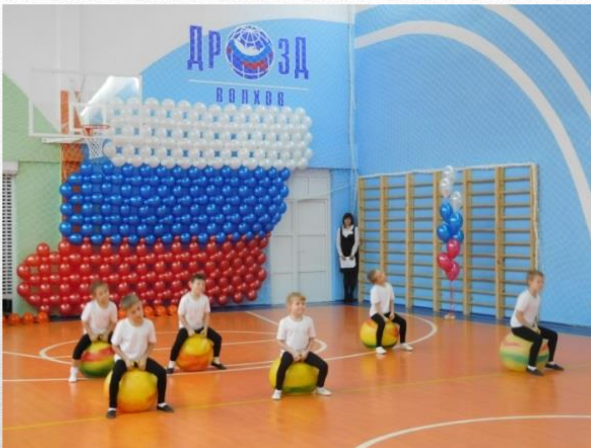
Открытие Волховского отделения Всероссийского движения «ДРОЗД» (2015 г.)